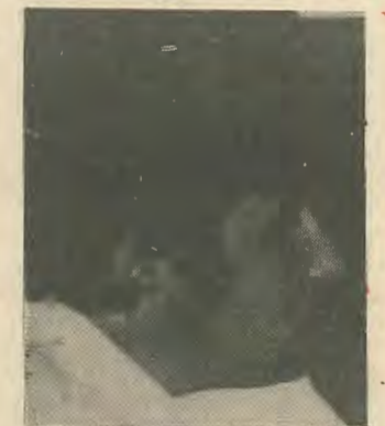
Έπρεπε να τους είχαμε διώξει από το 76 φιότητα Λυσσαρίδη, ΛΙΓΟΤΕΡΟ ΑΠΟ ΕΝΑ ΜΗΝΑ ΠΡΙΝ ΤΙΣ ΕΚΛΟΓΕΣ;

Τι άλλο μπορεί να είναι η αποβολή ηγετικού στελέχους της Κεντρικής Εκτελεστικής Γραμματείας της Σ.Ν. ΕΔΕΝ που ήταν πραγματικός δυναμίτης στη δουλειά για την υποψη-